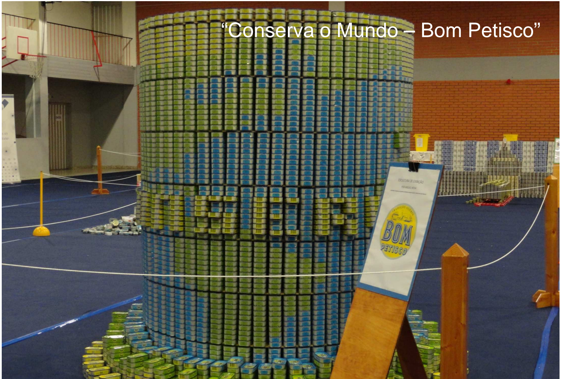
Escultura de exibição, por Miguel Neiva (ColorAdd)