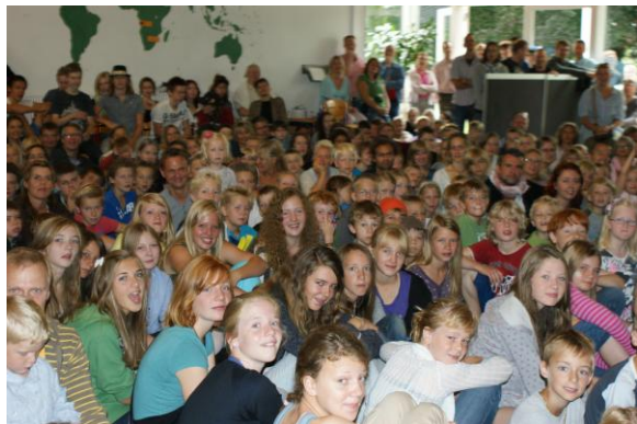
Reunião diária na escola, em Kon Tiki Skolen, na Dinamarca, 2010